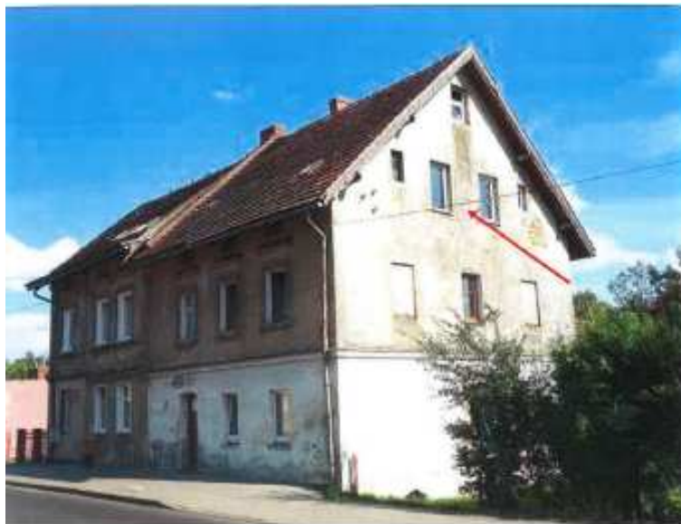
Widok elewacji frontowej- ul. Łużycka nr 46a.

na sprzedaż lokalu mieszkalnego Nr 3, znajdującego się w budynku położonym w Lubaniu przy ul. Łużyckiej 46a wraz z udziałem we współwłasności nieruchomości gruntowej (działka nr 48, AM 18, Obręb II o powierzchni 82 m 2 , JG1L/00016386/4)